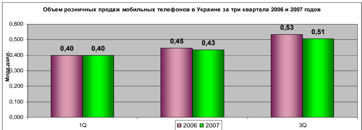
Диаграмма 2. Объем розничных продаж мобильных телефонов в Украине за три квартала 2006 и 2007 годов

Всего же за все время существования сотовой связи в Украине на конец 3 квартала 2007 года было продано в розничных сетях ритейлеров Украины 38,68 млн. сотовых телефонов.