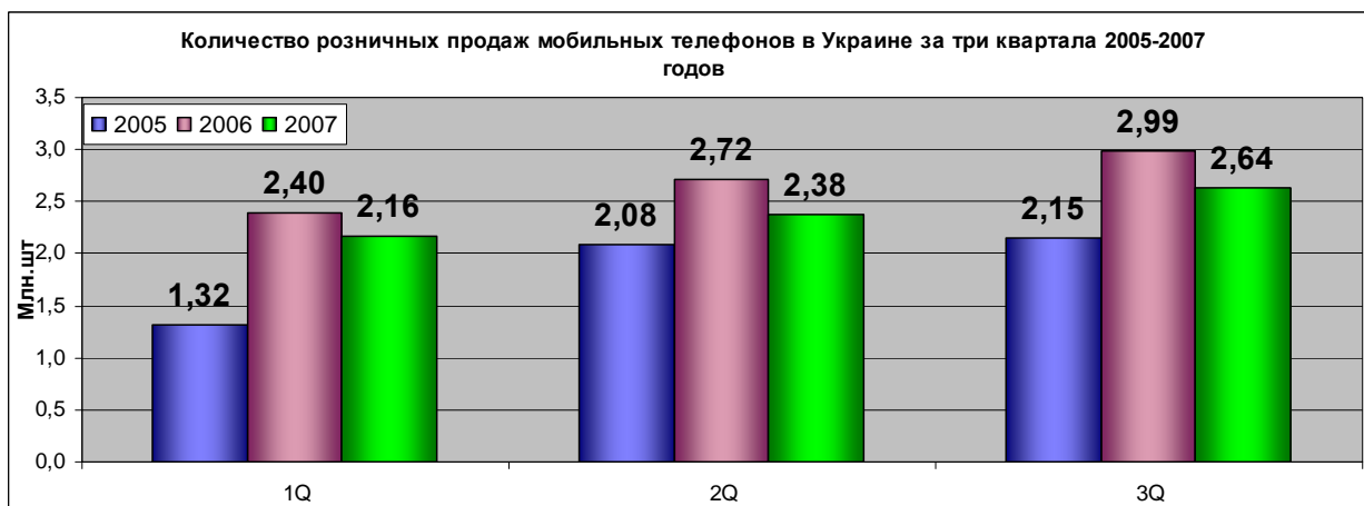
Диаграмма 1. Количество розничных продаж мобильных телефонов в Украине за три квартала 2005-2007 годов

На диаграмме приведены количество розничных продаж сотовых телефонов в Украине за три квартала 2005-2007 годов.