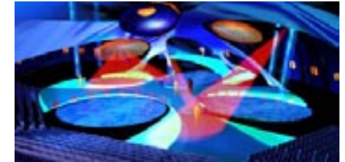
Дизайн сцены для проведения финального концерта конкурса "Евровидение 2004" в Истанбуле